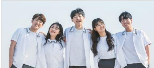
교육 · 청소년