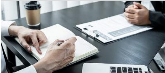
고용 · 노동