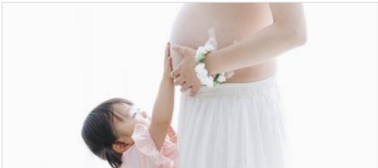
여성 · 가족 · 복지