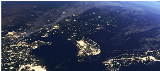
통일 · 안보