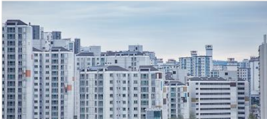
주택 · 부동산