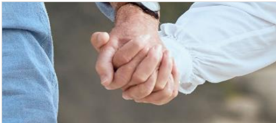
건강 · 보건